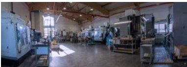
Panoramaansicht der Fertigungshalle

Höchste Präzision, kurze, wirtschaftliche Fertigungszeiten und selbstverständlich extrem hohe Wiederholgenauigkeit für die Serienfertigung sind die Kriterien, nach denen wir unsere Maschinen auswählen. Die folgende Übersicht listet einen Teil unseres Maschinenparks. Unten stehend finden Sie die Liste zum Download auch im PDF-Format.